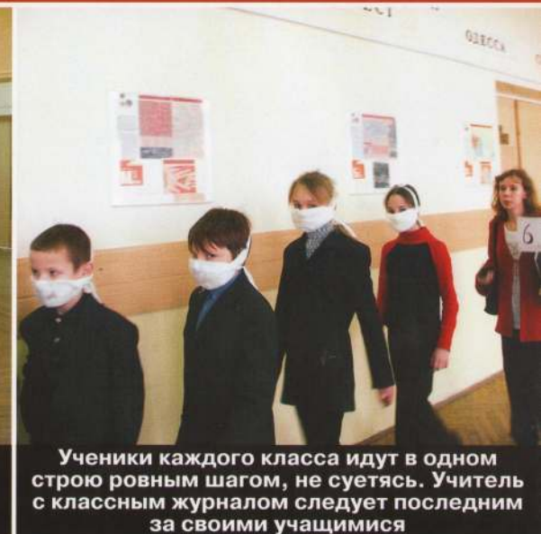
Ученики каждого класса идут в одну строю ровным шагом, не суетятся. Учитель с классным журналом следует последним за своими учащимися