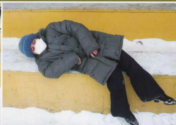
Уложить его поудобнее, расстегнуть одежду