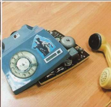
несвоевременно вызваны пожарные