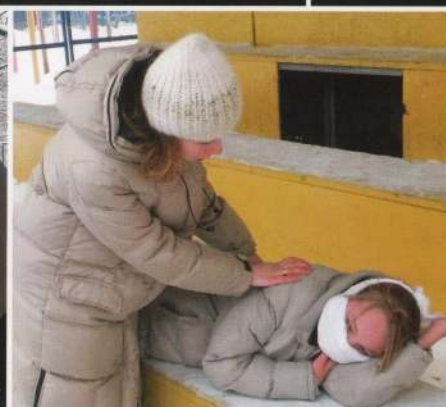
При потере сознания более чем на 4 мин. - перевернуть пострадавшего на живот