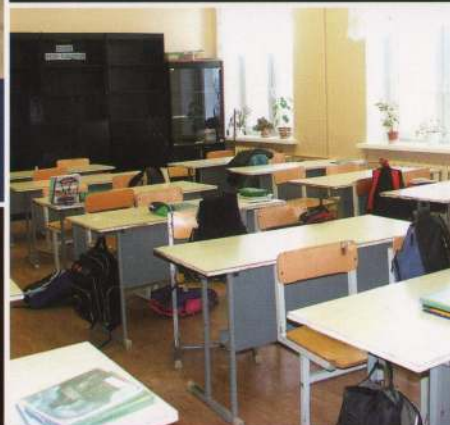
мебель, пластиковая облицовка