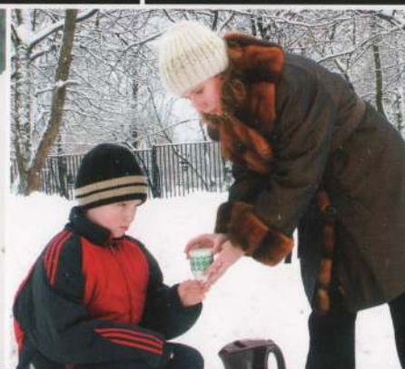
При ухудшении состояния - дать обильное сладкое питье (чай)