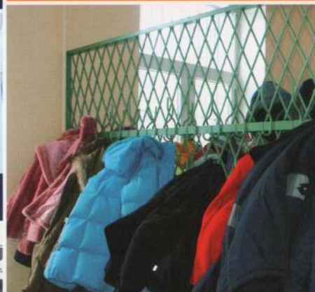
шторы, занавески, одежда