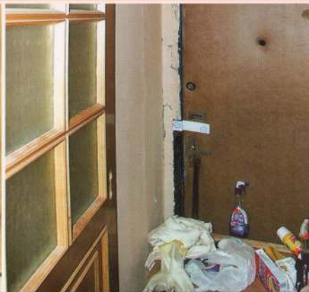
отсутствуют запасные выходы или они захламлены