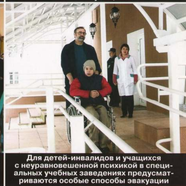
Для детей-инвалидов и учащихся с неуравновешенной психикой в специальных учебных заведениях предусматриваются особые способы эвакуации