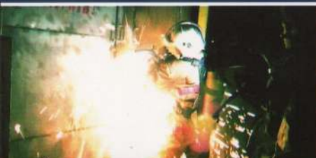
сварочные работы, окурки

Беда приходит при наличии источника огня и топлива для него способствует пожару беспечность