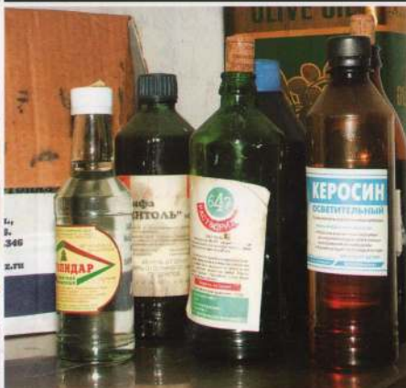
пожаро- и взрывоопасные вещества