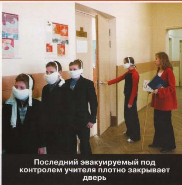
Последний эвакуируемый под контролем учителя плотно закрывает дверь