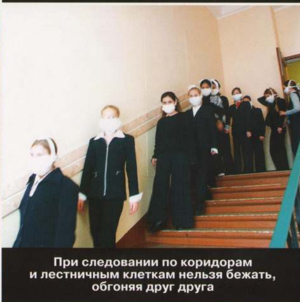
При следовании по коридорам и лестничным клеткам нельзя бежать, обгоняя друг друга