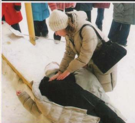
Растереть грудь, тело. Укрыть потеплее. Дать понюхать нашатырный спирт