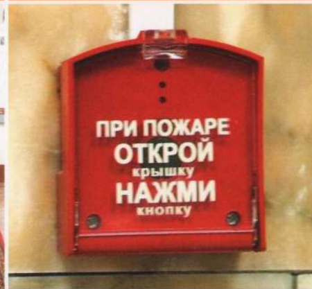
отсутствует или неисправна пожарная сигнализация, не хватает средств пожаротушения