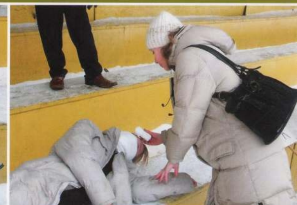
Приложить холод к голове