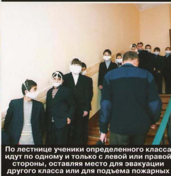
По лестнице ученики определенного класса идут по одному и только с левой или правой стороны, оставляя место для эвакуации другого класса или для подъема пожарных