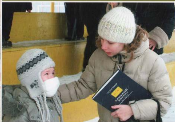
Пострадавшего надо как можно быстрее вынести из опасной зоны на свежий воздух