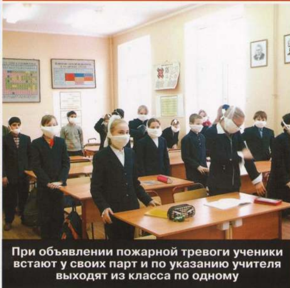
При объявлении пожарной тревоги ученики встают у своих парт и по указанию учителя выходят из класса по одному